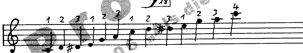
Blues-Tonleiter C-Dur = Blues-Tonleiter A-moll

In den Musikgattungen Blues, Boogie-Woogie, traditioneller Jazz und Rock werden Melodien überwiegend mit Tönen von Blues-Tonleitern gebildet. Als Beispiele für deren vielseitige Verwendungsmöglichkeiten und als Anregung für Deine eigenen Improvisationen (Improvisation ist das Spielen ohne Vorbereitung aus spontanem Antrieb) wurden für die rechte Hand in allen acht Chorussen dieses Stückes fast ausschließlich Töne aus den beiden unten stehenden Blues-Tonleitern benutzt. Eine ausführliche Anleitung zum Improvisieren findest Du in den Theorie-Heften dieser Serie (siehe hierzu die Übersicht auf Seite → 18).